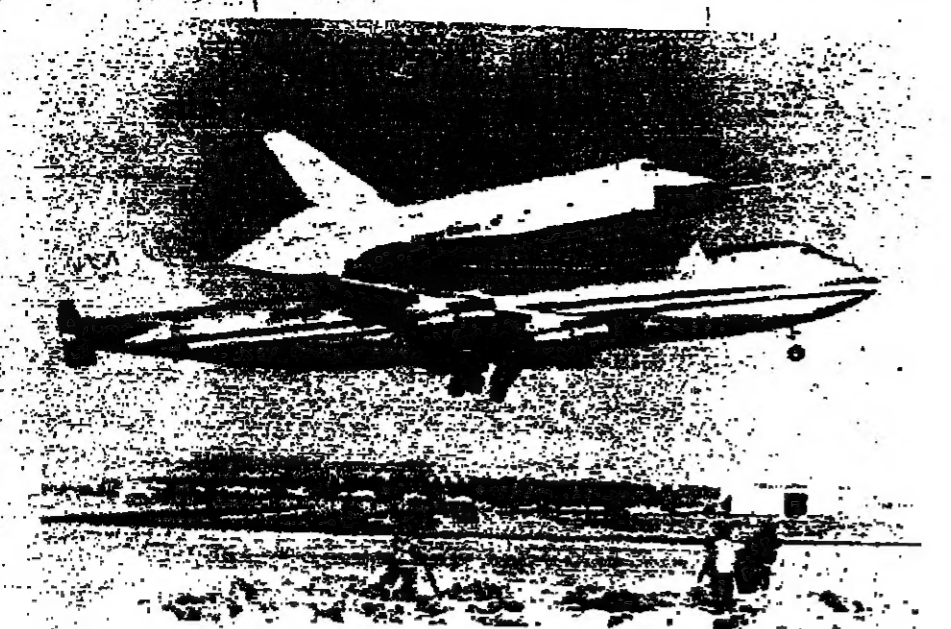
المركز الفضائي في أول رحلة فضائية له

من المقرر ان تكتمل مراحل بناء مصنع شركة السوييس للاسمنت قطاع خاص ، والذي سوف يعمل بطاقة انتاجية قدرها مليون طن سنويا في سيف عام ١٩٨٠ . وتوقع المصنع على مسافة ٥٥ كيل مترًا جنوب غرب مدينة السوييس ، وهو ثمرة جهود مكثفة ومتواصلة بين الشركات المصرية والأمريكية ، ويتوقع لهذا المشروع ان يساهم في دعم الحركة الصناعية القومية على أرض مصر في وتوفير فرص عمل لثلاث من المهرين . وتقدر قيمة العقد بقرابة ٦٦ مليون دولار ، المرتب مع شركة نوري - كاتسوكوا ، يا بالولايات المتحدة ، نظر قباها بكافة الاموال الهندسية التفصيلية وتوريد المعدات والمواد الرئيسية والمساعدة لكافة مراحل العمل التي يتطلبها المشروع ، ابتداء من مرحلة تسيير المواد الخام حتى مرحلة تعبئة الاسمنت المنتج . وسوف تقوم شركة نوري ايضا بتزويد المشروع بكافة لوازمه من المقتنيات المعدنية وايضا بالآلات التي هي الضرورية للإشراف على انشاء المشروع وتنمية مراحل العمل والاداء . وتعتبر شركة نوري « جاكس كوربوري » رائدة أعمال تصنيع وصناعة المعدات الثقيلة اللازمة للمحاملات الكيماوية والمعدنية والنحيم في ثلوث البيئة والنقل بواسطة الهياكل المصنوعة وتشييد الهياكل . وسوف يجرى المصنع باحث ما توصل اليه التكنولوجيا من المعدات اللازمة لصناعة الاسمنت .. ويعتبر أول مشروع مصري في صناعة الاسمنت في ظل سياسة الانفتاح منذ عام ١٩٦٠ . في مصر .